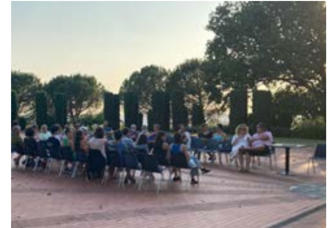
En plein air - Commune de Cenon, Château Tranchère

3 personnes max : 1 comédien, 1 médiatrice, 1 chargée de production