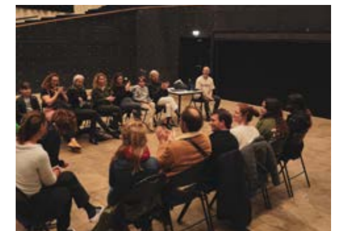
Salle des fêtes - Festival Têtes d'Oranges, Glob Theatre