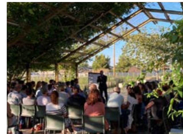
En plein air, sur le parvis des archives de Bordeaux Métropole